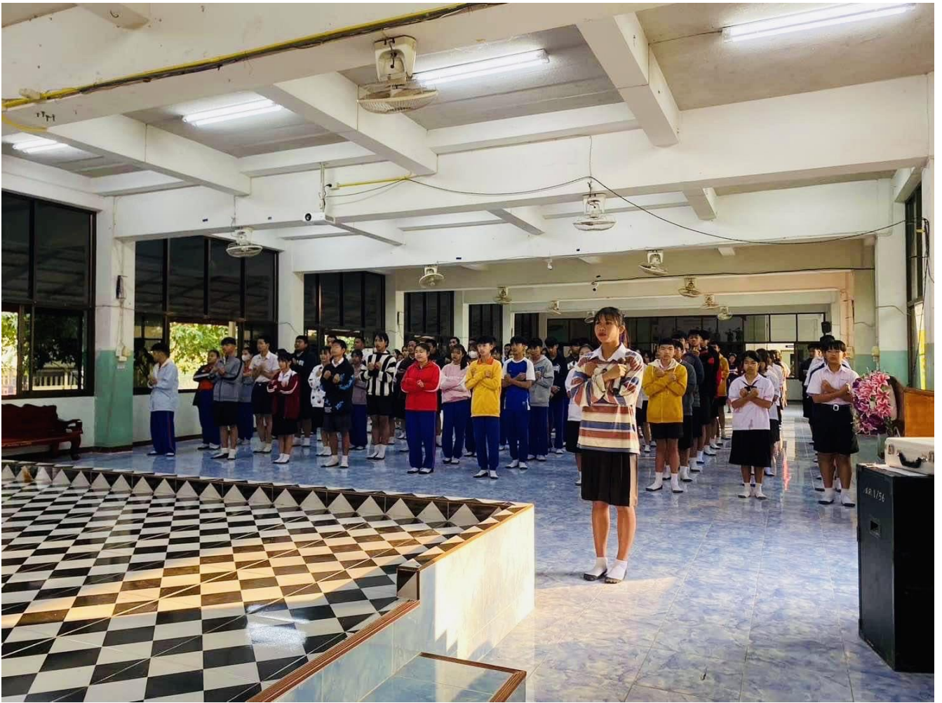
ภาพการทำสัญลักษณ์การต่อต้านทุจริต และประกาศเจตจำนงศัการไม่รับของขวัญและของกำนัล No Gift Policy