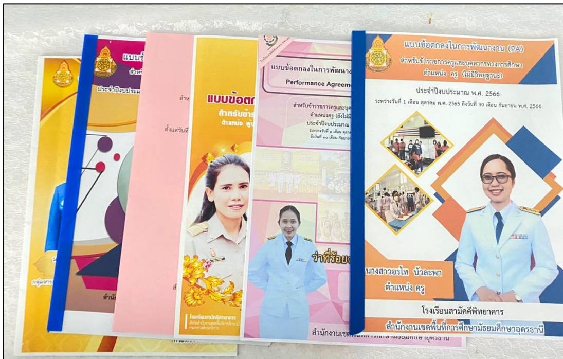
แบบข้อตกลงในการพัฒนางาน (PA) ข้าราชการครูและบุคลากรทางการศึกษา